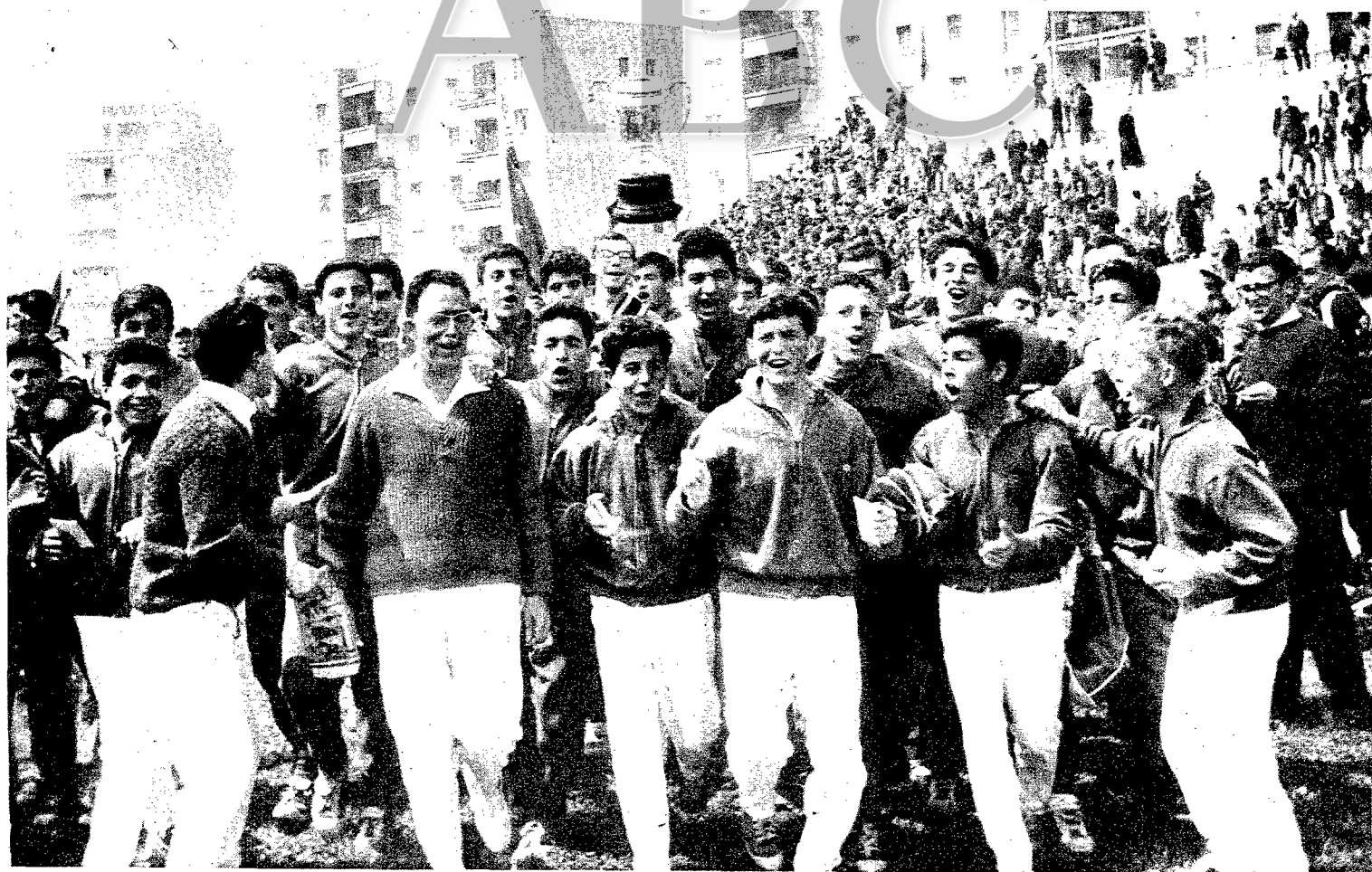
LA UNIVERSIDAD LABORAL DE CORDOBA VENCE EN ATLETISMO Mostrando jubilosamente la copa obtenida, los muchachos de la Universidad Laboral de Córdoba, recorren el campo de Vallehermoso, tras proclamarse vencedores en atletismo, en los XV Juegos Nacionales Escolares, clausurados el domingo.