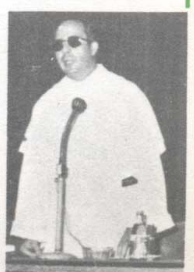
Un momento de la intervención del P. Rector en el acto académico.