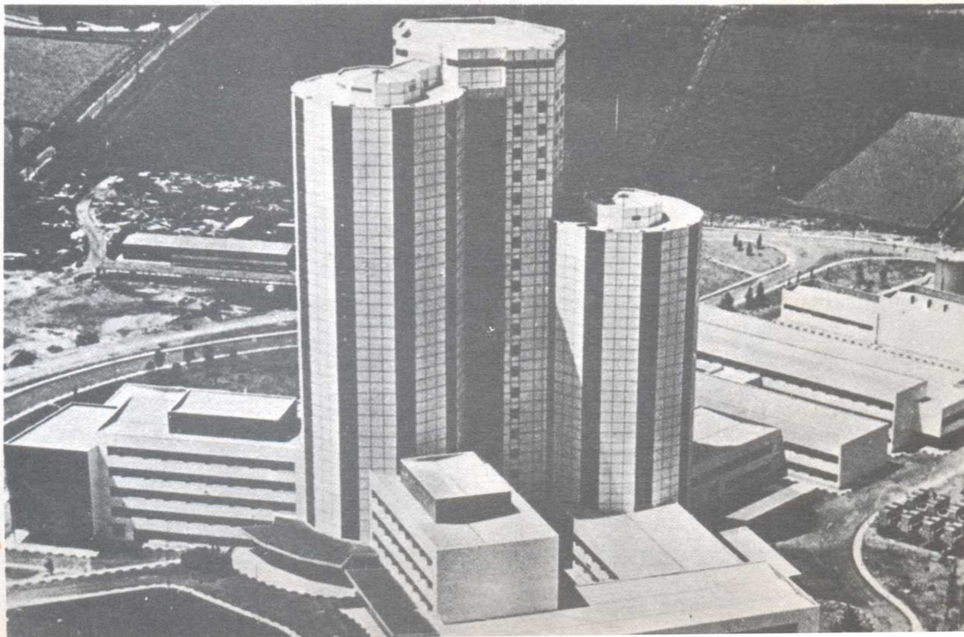
Perspectiva de la Residencia Sanitaria "Príncipes de España", de la Seguridad Social, en Hospitalet de Llobregat (Barcelona).

Esta asistencia se otorga, prácticamente, sin limitación en su contenido, a todos los trabajadores y comprende: el tratamiento médico y quirúrgico de las lesiones o dolencias sufridas, las