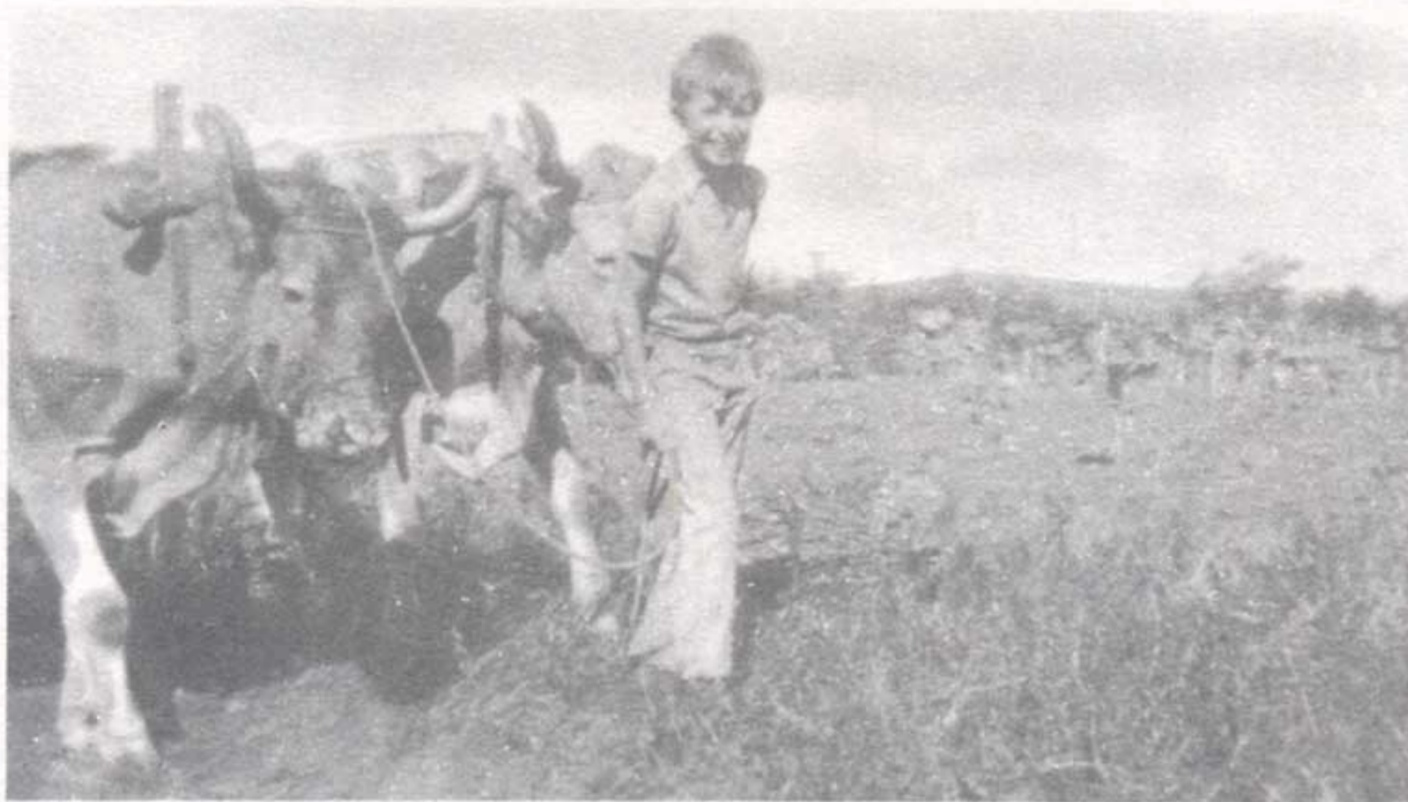
Aquí vemos como la Galicia Rural conserva el tradicional sistema de cultivo de la tierra.

niendo por otra parte de las mínimas condiciones de seguridad, higiene, iluminación que cabe exigir a un local destinado a tal fin. La solución a este problema, fue posible gracias al decidido interés demostrado por todas las personas, cediendo sus casas, que fueron habilitadas para aulas de clase; de esta forma logramos disponer de 4 locales, distribuidos en distintos lugares de la Parroquia para facilitar a los alumnos sus desplazamientos.