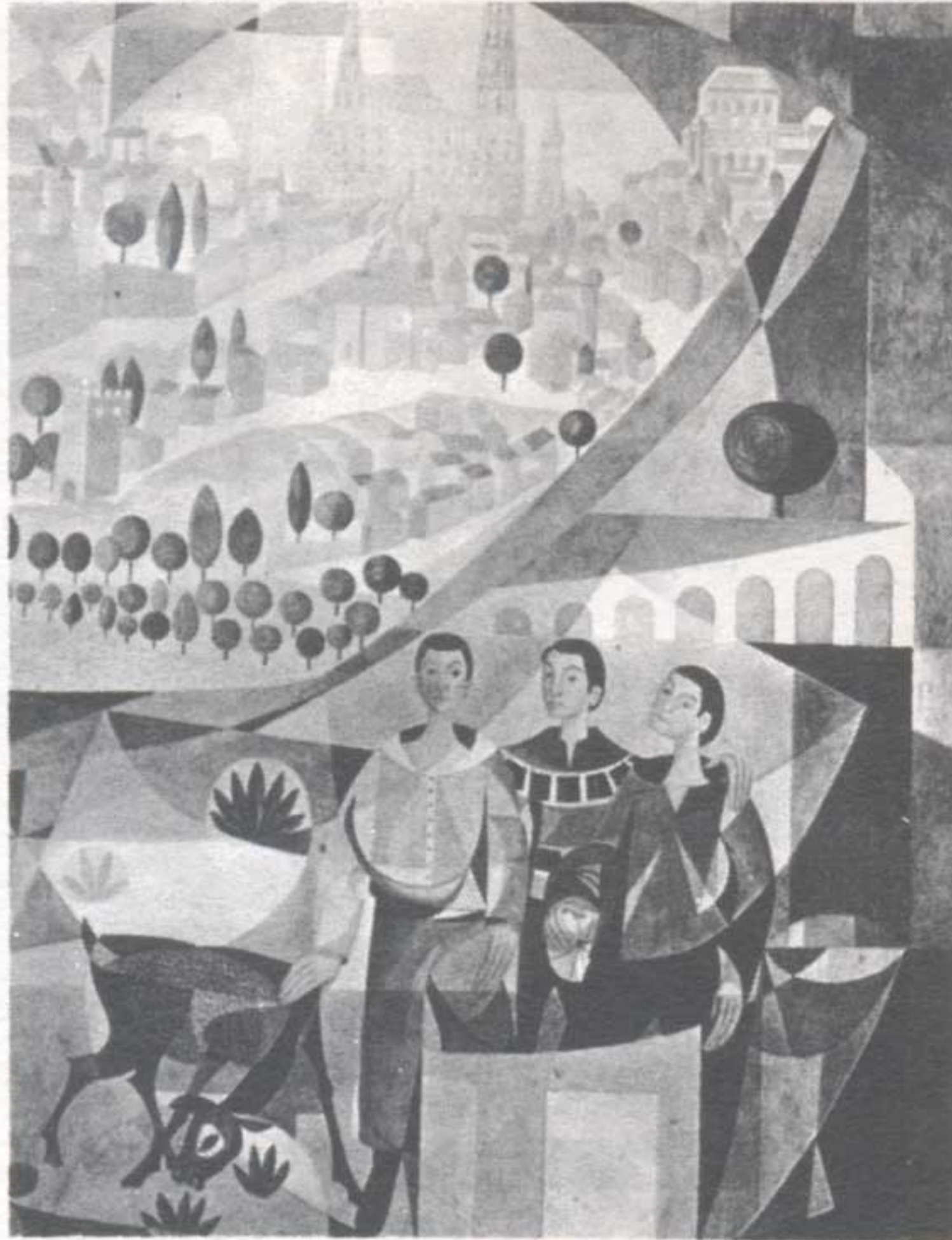
Fragmento del mural de 90 metros cuadrados que decora uno de los vestíbulos del Centro.

Desde la inauguración del Centro, han transcurrido ya dos cursos escolares, durante los cuales se ha trabajado incansablemente por dinamizar al máximo el sistema promocional. No hay que olvidar que fundamentalmente la zona rural toledana se encontraba necesitada de un Centro que respondiera a las exigencias ineludibles de una promoción humana, social y cultural de los hijos de trabajadores. Y en este sentido se han orientado los esfuerzos de las sucesivas Campañas de Becas,