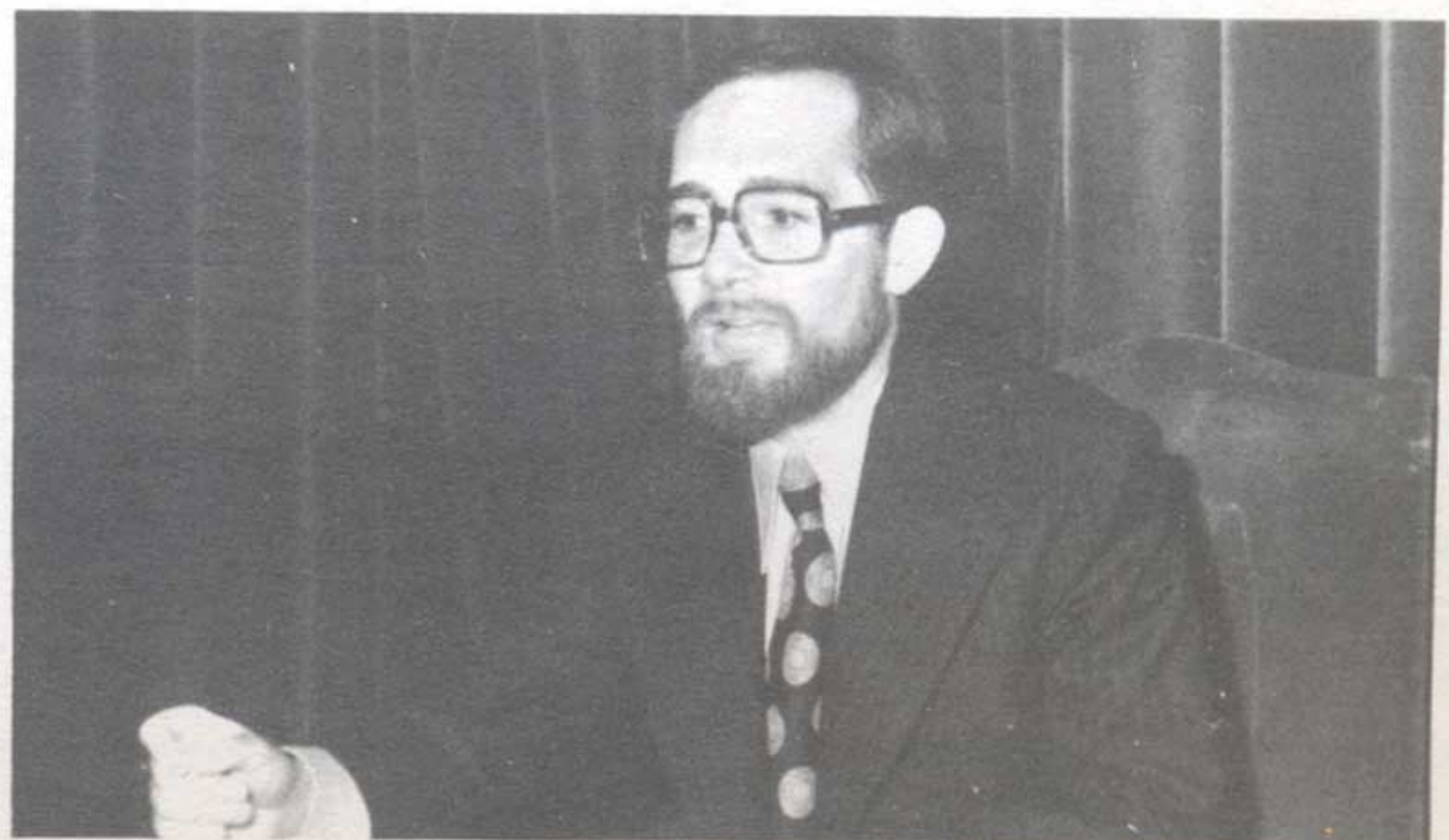
Domínguez Narbaiza en un momento de su conferencia.

Más el logro en el que se ha centrado la máxima atención, y que sin llegar a cubrir nuestras aspiraciones, ha dado un fruto notable, es el establecimiento de unas relaciones entre empresas o